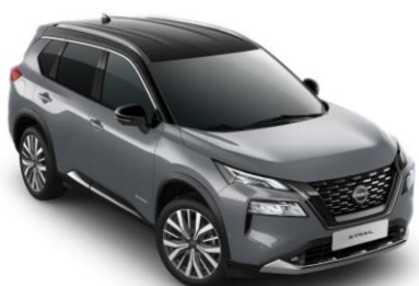
Gyöngyházzsürke - Fekete XEX - 450 000 Ft