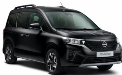
Enigma fekete GNE – 165.100 Ft