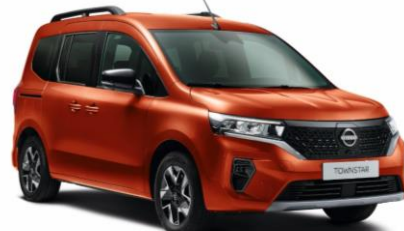
Terrakotta CNZ – 165.100 Ft