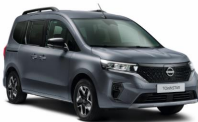
Szürke KPW – 88.900 Ft